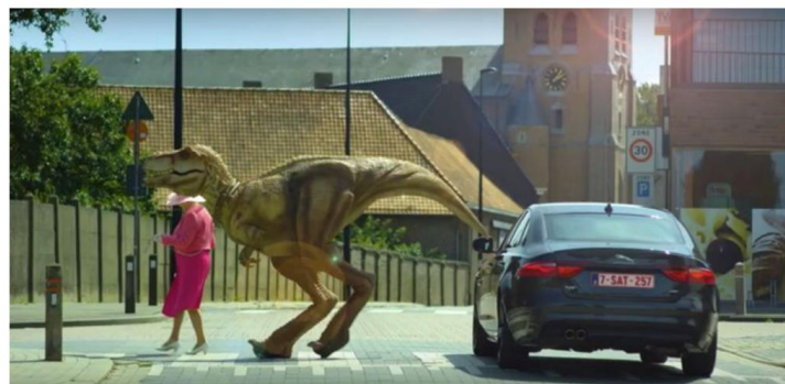
© Galileo - Plots liep er een dinosaurus in Etikhove (Maarkedal), voor de reclamespot van Galileo.