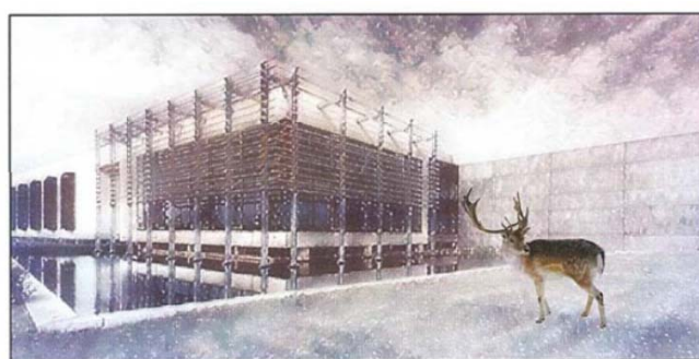
INTERCLUB NIEUWJAARSRECEPTIE VLAAMSE ARDENNEN 2018